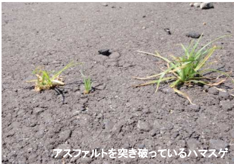
アスファルトを突き破っているハマスゲ

カヤツリグサ科の多年草。ハマスゲは熱帯から温帯にかけて分布し、世界中で最も多くの国と地域で問題となっていることから世界の10大雑草にもあげられている代表的な耕地雑草である。特に亜熱帯、熱帯地域で主要作物、プランテーションに被害を与えている。果樹園、畑、芝地、荒地、海岸の砂地、道路など土壌条件に対する適応範囲が広く、日当たりの良いところであればどこにでも生育可能である。日本では特に関東以西の暖地で被害が大きい。