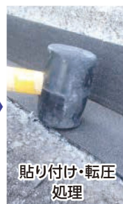
貼り付け・転圧 処理