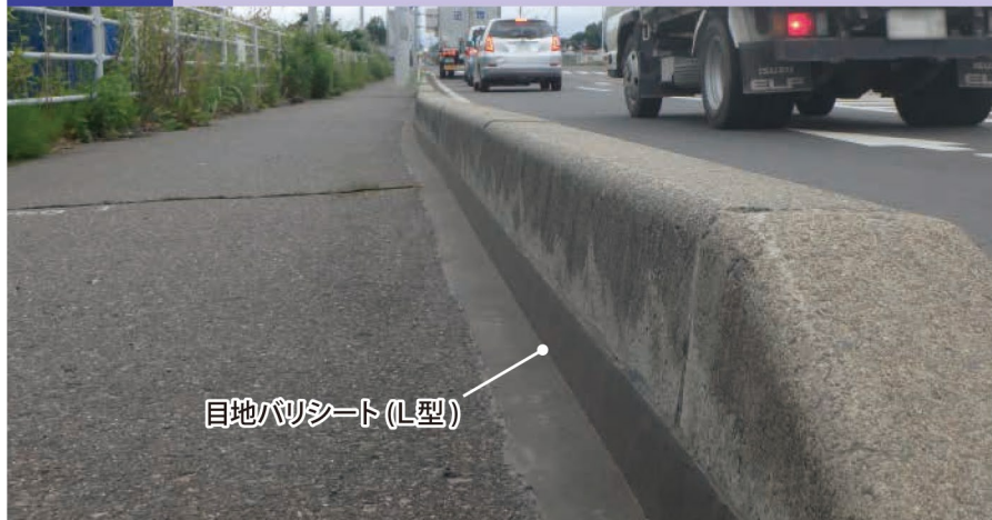
目地バリシート(L型)