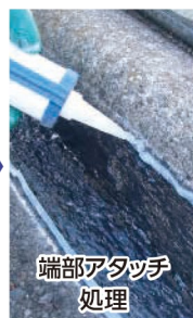
端部アタッチ 処理