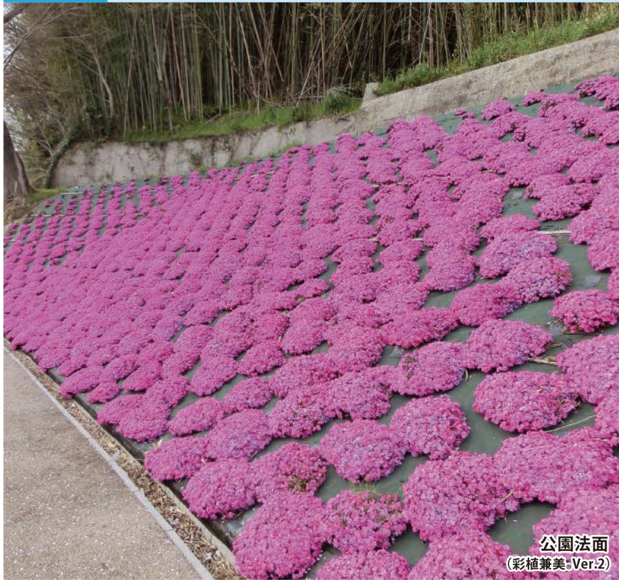
公園法面 (彩植兼美®.Ver.2)

光をシャットアウトし、適度な柔軟性と高い透水性・通気性で目的の植物をしっかりと育てます。 耐用年数：約10年