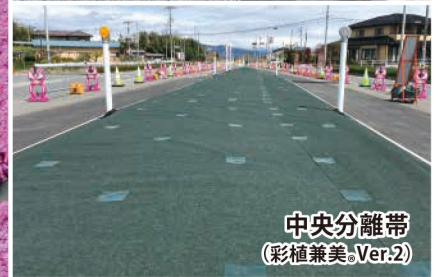
中央分離帯 (彩植兼美®.Ver.2)