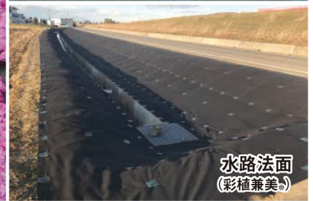
水路法面 (彩植兼美®)