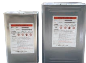
プライマーPR1-5L(左) プライマーPR1-15L(右)