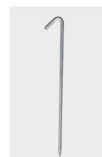
たけガードアンカー