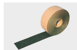
たけガードテープ