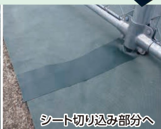
シート切り込み部分へ