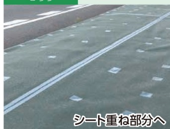
シート重ね部分へ