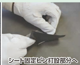
シート固定ピン打設部分へ