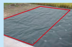
チガヤテープ使用(赤枠内)