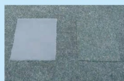
粘着テープ チガヤテープ