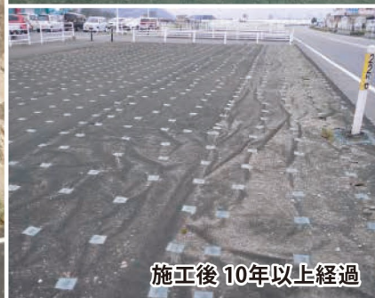
施工後10年以上経過