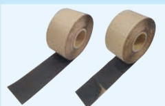
GUテープ/スリット品

表層にGUシートと同じ素材を使用することにより、使用後はGUシートと同化します。