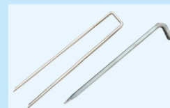
Φ6mm以上のピンをご利用ください。 (P17参照)