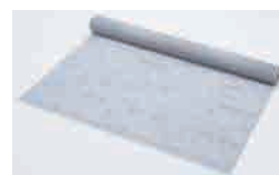
つるガードネット