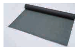
つるガードシート