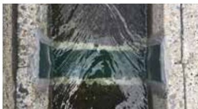
補修後の目地の様子

福井県は白くてほっこりおいしいコシヒカリ発祥の地。お米の産地とだけあって、福井県にはたくさんの水田がズラリ。