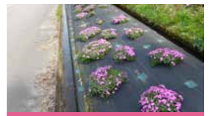
手入れをして春に咲きました