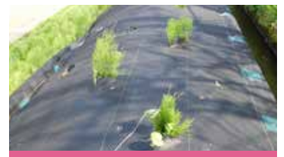
スギナに覆われたシバザクラ