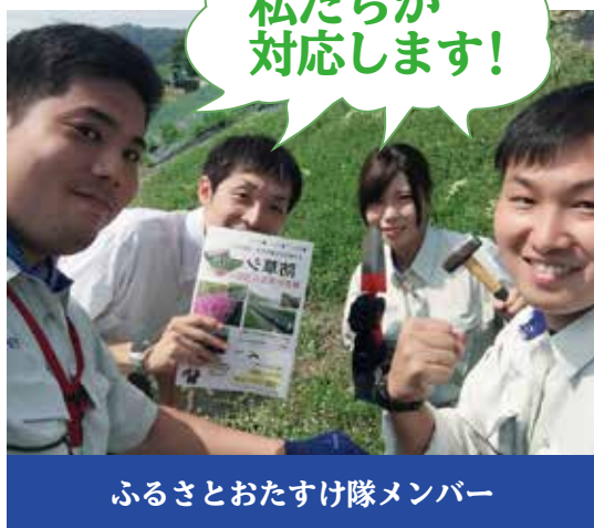
ふるさとおたすけ隊メンバー