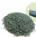
保護砂 ※写真はグリーン