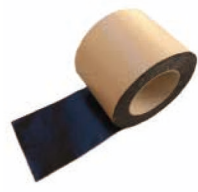
マクレーン両面テープ